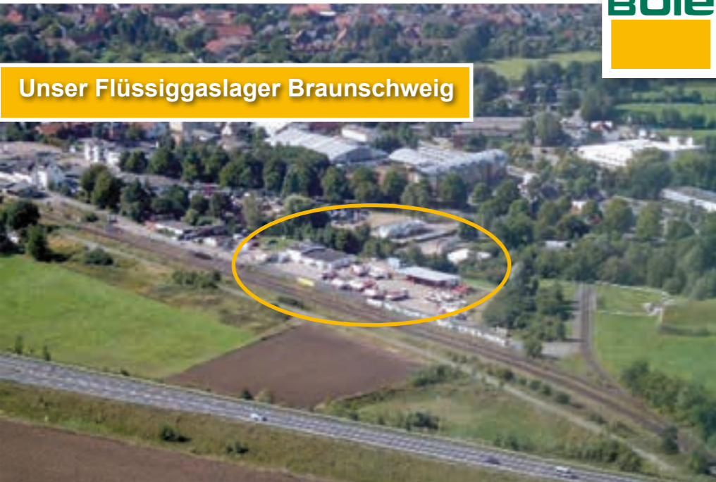
Unser Flüssiggaslager Braunschweig